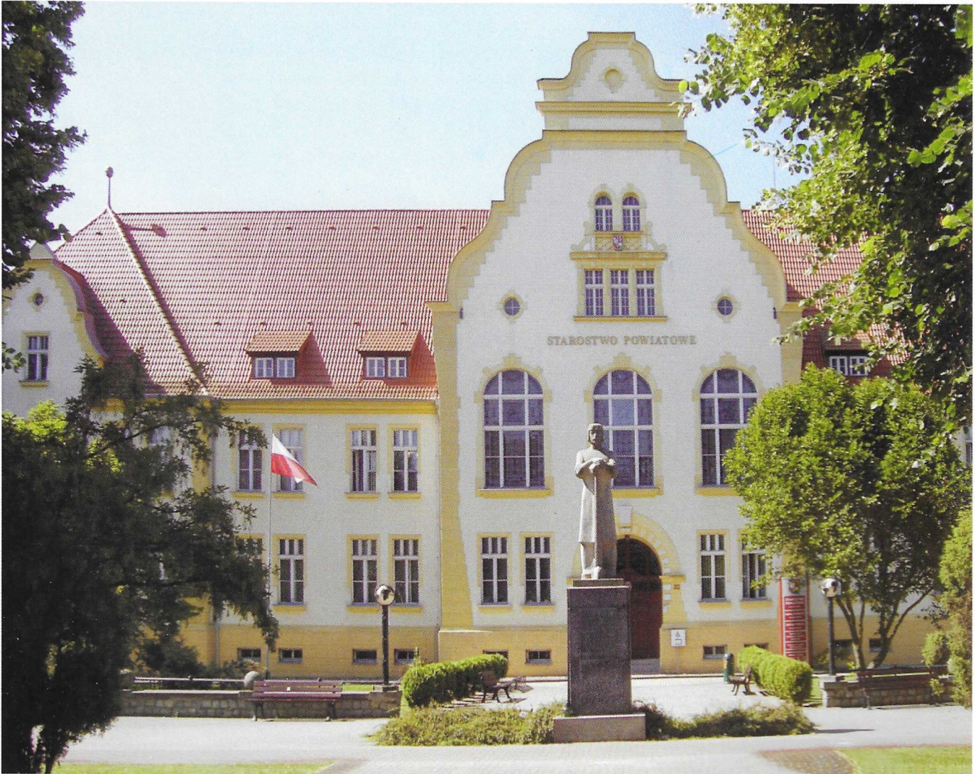
Starostwo Powiatowe / Landratsamt Heute: Aleja Piasta 32, 77-400 Złotów • Früher: Bahnhofstraße 32, Flatow