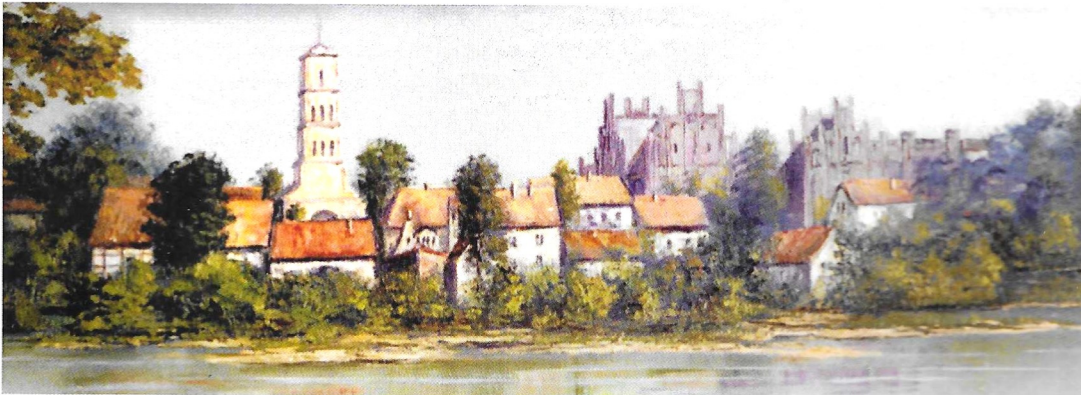
Flatow-Panorama • Motiv im Landratsamt Gifhorn